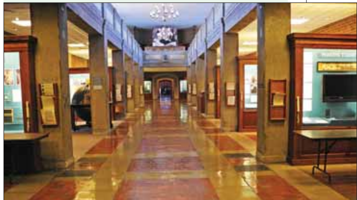
نمایی از موزه پرکینز در راهرو ساختمان هاو <