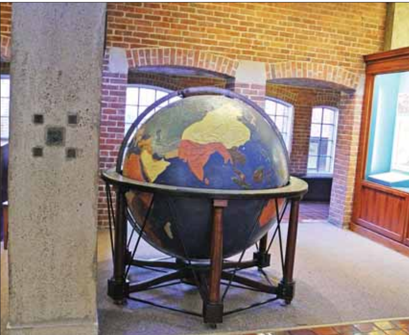
↑ کره بزرگ جغرافیا

دیده می‌شود. گرچه تمامی این موزه از نظر تاریخی جالب توجه است، شاید بتوان گفت اولین چیزی که به محض ورود به راهروی ساختمان هاو جلب توجه می‌کند، کره جغرافیایی بسیار بزرگی است که بر روی پایه‌ای قرار داده شده است. به گفته راهنمای این موزه، دکتر هاو دو کار بزرگ انجام داد: یکی سفارش ساخت این کره جغرافیایی را داد که در سال ۱۸۳۷ ساخته شد. این کره جغرافیایی بزرگ‌ترین محصول تلاش‌های دکتر هاو بود ولی بهترین نبود! اقدام مهم دیگر دکتر هاو آموزش «لورا بریجمن» بود که بهترین کار او بود؛ زیرا با این کار آموزش ناشنوایان- نابینایان را پایه‌گذاری کرد.