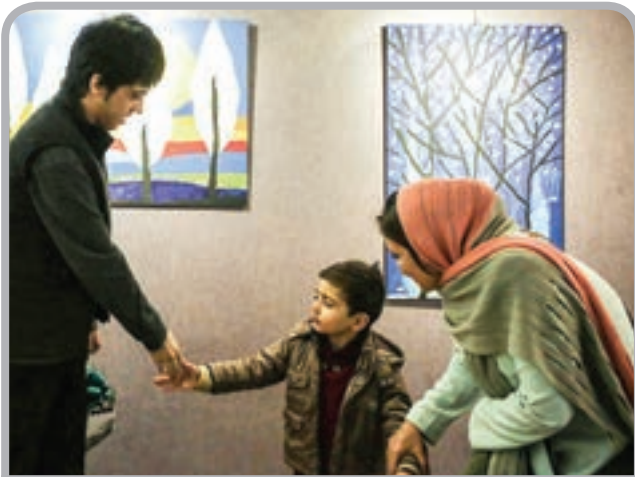
* نمایشگاه نقاشی «مرد بارانی»