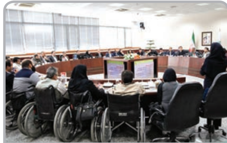
* جلسه فضیلت پاسخ‌گویی برای افراد دارای معلولیت