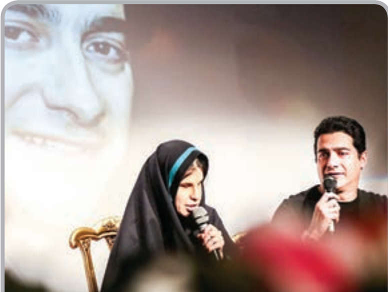
* هم‌خوانی همایون شجریان و تکتم در مؤسسه توان‌بخشی همدم