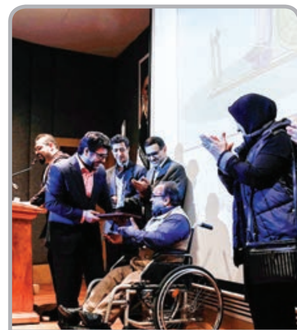
* جشنواره کاریکاتور شهر دسترس پذیر