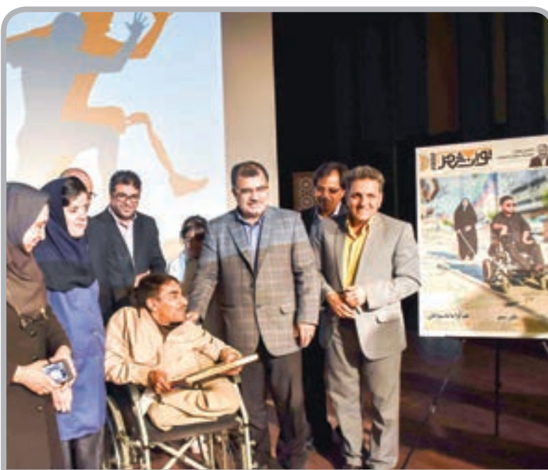
* روز جهانی معلولان