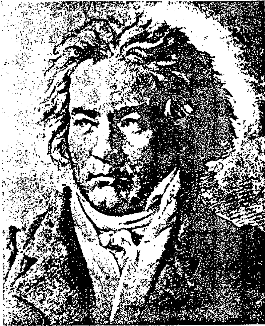
۴۷ سالگی: دوران هامر کلاویرسوناتا